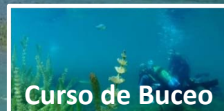
Curso de Buceo

Un 10% de descuento para todos los Bonos reservados on line, consigue un regalo original y funcional, con la garantía de Ruideractiva, empresa pionera en Turismo Activo, fácil de reservar y flexibilidad en fechas